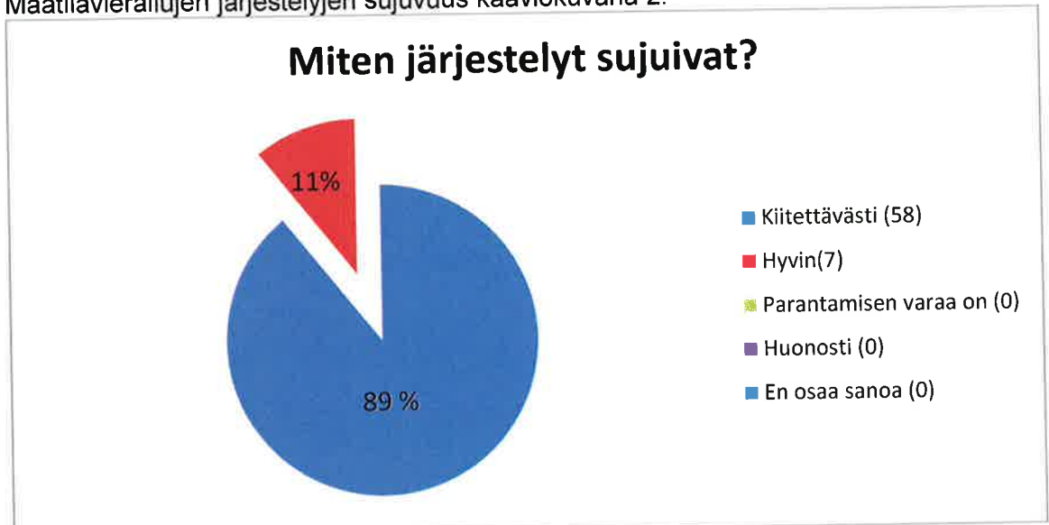
Kaavio 2. Maatilavierailujen järjestelyt.

Yrittäjien oppitunnit kouluilla ovat saaneet myös paljon kiitosta opettajilta sanallisesti ilmaistuna siten, että yrittäjät osaavat ammattitaidolla kertoa ammattiinsa ja omaan työhönsä liittyvistä asioista kiinnostavasti. Yrittäjä kohtaa oppilaat ensin koulussa pidettävällä oppitunnilla ennen maatilavierailua, ja saa tuntumaa siitä millainen ryhmä maatilalle on tulossa, ja mitkä ovat myös tiedolliset kiinnostukset oppilailla.