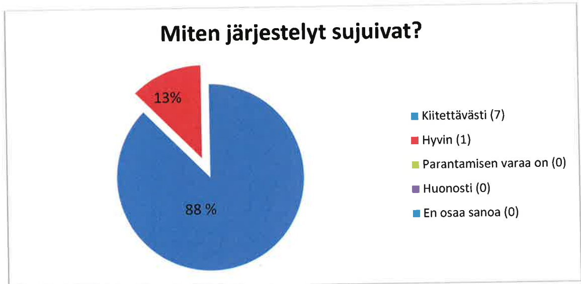
Kaavio 4. Luonnonvara-alan koulutusmahdollisuuksien tiedotustilaisuudet kouluilla

Luonnonvara-alan koulutusmahdollisuuksista tiedotustilaisuudet kouluissa kaavio 4.